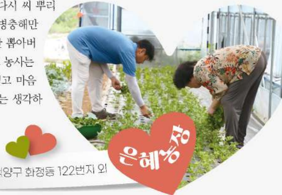
고양시 덕양구 화정동 122번지 외

은혜농장에서 재배하는 쌈채소는 상추, 깻잎, 레드치커리, 청치커리, 케일, 샐러리, 작근대, 흰근대, 청겨자, 적겨자 등으로 식이섬유는 물론 엽산, 비타민A·C·K, 미네랄, 항산화물질이 풍부하다. 싱싱한 쌈채소는 몸의 신진대사를 돕고 건강한 생활에 도움을 준다.